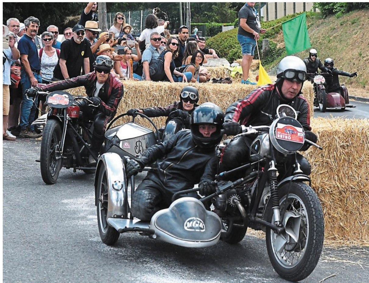
Le Puy-Notre-Dame, hier. Sur les side-cars, pilotes et singes ont assuré le spectacle sur le circuit tracé dans le bourg.