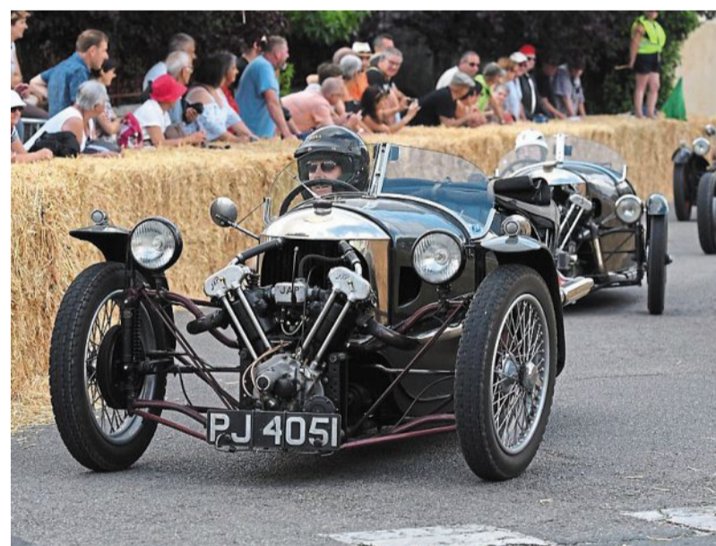
Les cyclecars ont la cote dans le cœur des spectateurs.