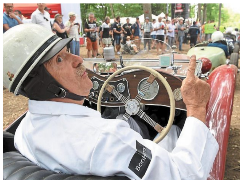
Le Grand Prix rétro, un état d'esprit qui se partage !