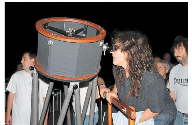
L'astronomie est à l'honneur ce lundi.