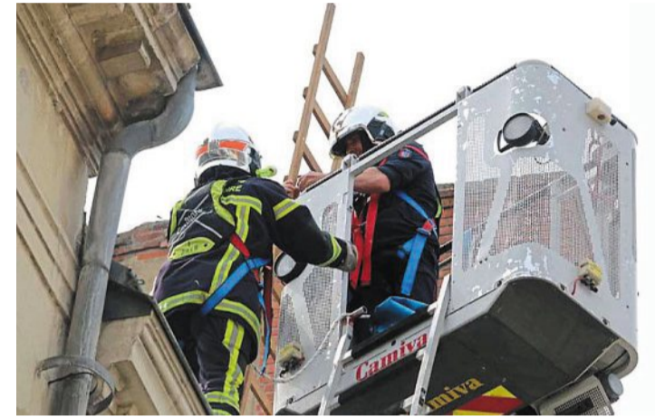
Les pompiers ont déployé une grande échelle pour accéder au toit.

Cinq sapeurs-pompiers sont intervenus hier matin, rue Corneille à Saumur. Prévenus par un riverain et la Police, ils ont retiré d'un toit des morceaux de tuffeau qui