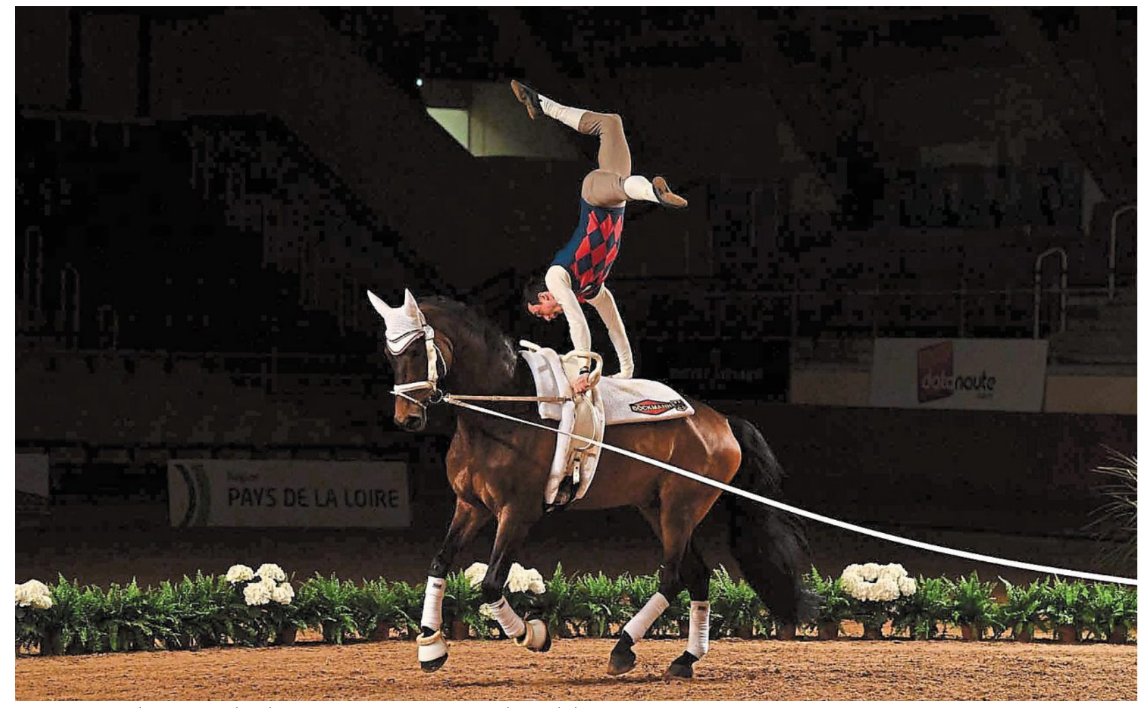
Les concurrents des épreuves de voltige ne restent pas cantonnés sur le site de la compétition.

Louise BEDA AKICHI redac.saumur@courrier-ouest.com