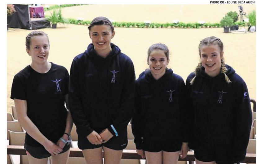
Les jeunes athlètes de l'équipe de voltige écossaise attendent l'heure de leur passage dans les gradins du manège de l'ENE.

80 000 EUROS L'organisation de la Coupe du monde de voltige a nécessité le déblocage de 80 000 € supplémentaires dans les finances du Comité équestre de Saumur.