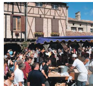
Le marché de Lautrec.

Féerie garantie en faisant étape au village de Lautrec, célèbre pour ses ravissantes maisons à colombage et sa halle du XII e siècle faisant office de marché de producteurs tous les vendredis matin. Érigé sur une butte, il offre un panorama exceptionnel sur les Monts de Lacaune et la Montagne Noire. L'occasion de se restaurer à l'Oc-Xalis, au cœur d'une belle demeure médiévale. La Pavlova aux figues fraîches et crémeux chocolat blanc y est irrésistible. Pour une randonnée à la fraîche, direction la Forêt de Grésigne, l'une des plus grandes chênaies au monde. S.M.