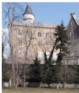
Le château de Lérans.

Commencez la visite avec le château du XII e siècle endommagé lors des guerres de religions puis restauré par l'école de Viollet-le-Duc au XIX e siècle. Poursuivez aux Halles gourmandes, en fin de matinée, afin d'aiguiser votre appétit. Puis cap sur Saint-Martin-d'Oydes, seul village circulaire d'Ariège dans lequel on visite, sur demande, l'église romane dont l'intérieur immaculé contraste avec les ocres des façades et des toits voisins. Envie de grand air ? Deux options : une balade à travers le Coteaux de Terrefort ou le tour du lac de Montbel. S.M. ( www.ariège-pyrenees-cathares.com ).