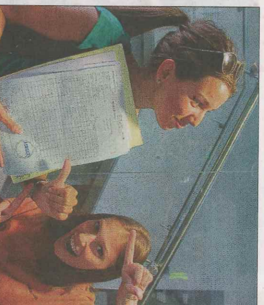
Comme Agathe, les bacheliers sont fiers de leurs résultats