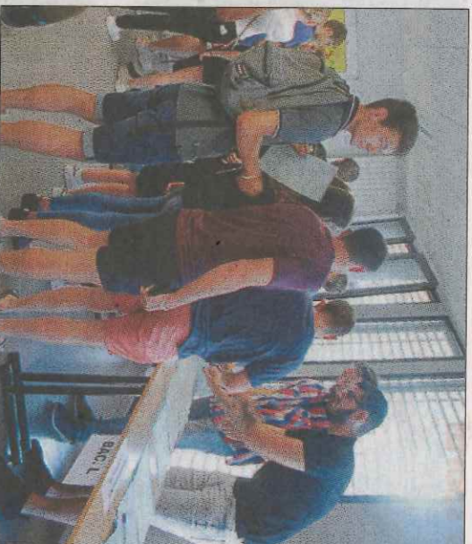
Objetif : Enfin tenir dans ses mains le précieux sésame.

VE LIBRE. Des problèmes avec l'alcool ? Permanence le 1 er samedi du mois, de 10 à 12 heures, maison des associations. Le 1 er vendredi du mois, commission femmes. Le 3 e vendredi, réunion publique à la mairie de Davézieux à partir de 20 h 30. Renseignements au 06.62.50.73.32, 04.75.33.16.68.