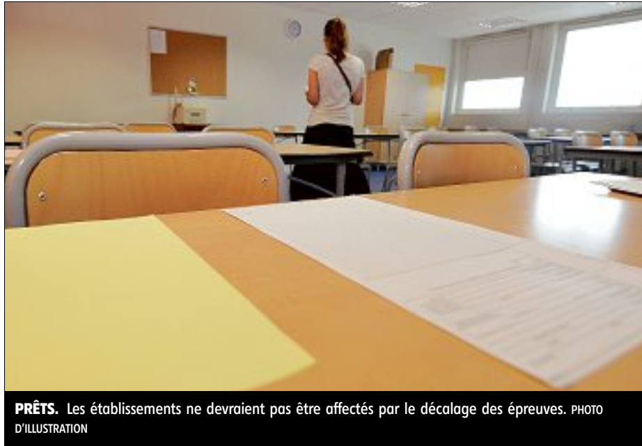
PRÊTS. Les établissements ne devraient pas être affectés par le décalage des épreuves. PHOTO D'ILLUSTRATION

Cette année, 8.927 collégiens du Loiret vont devoir se confronter aux épreuves du diplôme national du brevet. Aujourd'hui, les élèves planchent sur les sujets de français et de mathématiques. L'histoire-géographie et les sciences attendront demain.