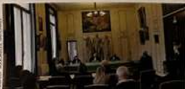
2002, CH. ASSOLANT, EL. SARONNET

En 2021, les caméras de LCP ont suivi cette entrepreneuse marseillaise et ses collègues dans un contexte de crise sanitaire ayant aggravé les difficultés financières de nombreuses sociétés. Extraits d'audiences, de délibérations, de formation au vocabulaire juridique sont autant d'instantanés captés par ce documentaire instructif sur les coulisses d'une institution méconnue. ➔ JÉRÔME FALÉS