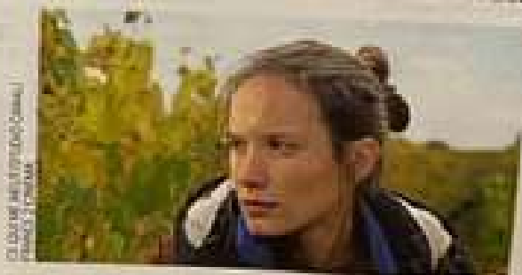
CLAUDE MATHÉ/STUDIO CANAL