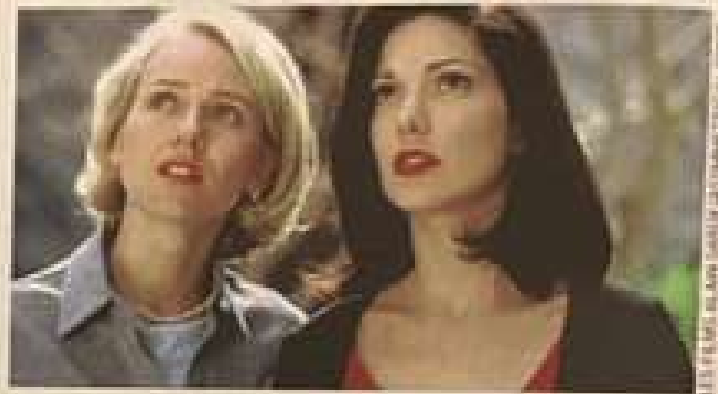
LES FILMS ICI DANS LE JOURNAL TRICOL

Depuis sa sortie en 2001, ce film de David Lynch a déchainé la curiosité des spectateurs. Aussi fascinante que déroutante, l'intrigue de Mulholland Drive est sujette à des interprétations diverses, tant le réalisateur brouille les pistes, dans une ambiance onirique - là réside tout le génie de Lynch. Entre dédoublement de personnalité et illusion, il immerge le spectateur dans un rêve