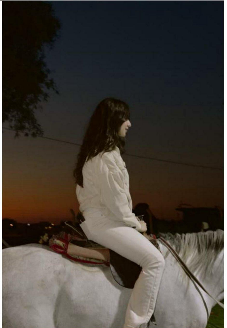
Au festival du cerf-volant, dans le parc d'Abu Nuwas, le 17 mars.