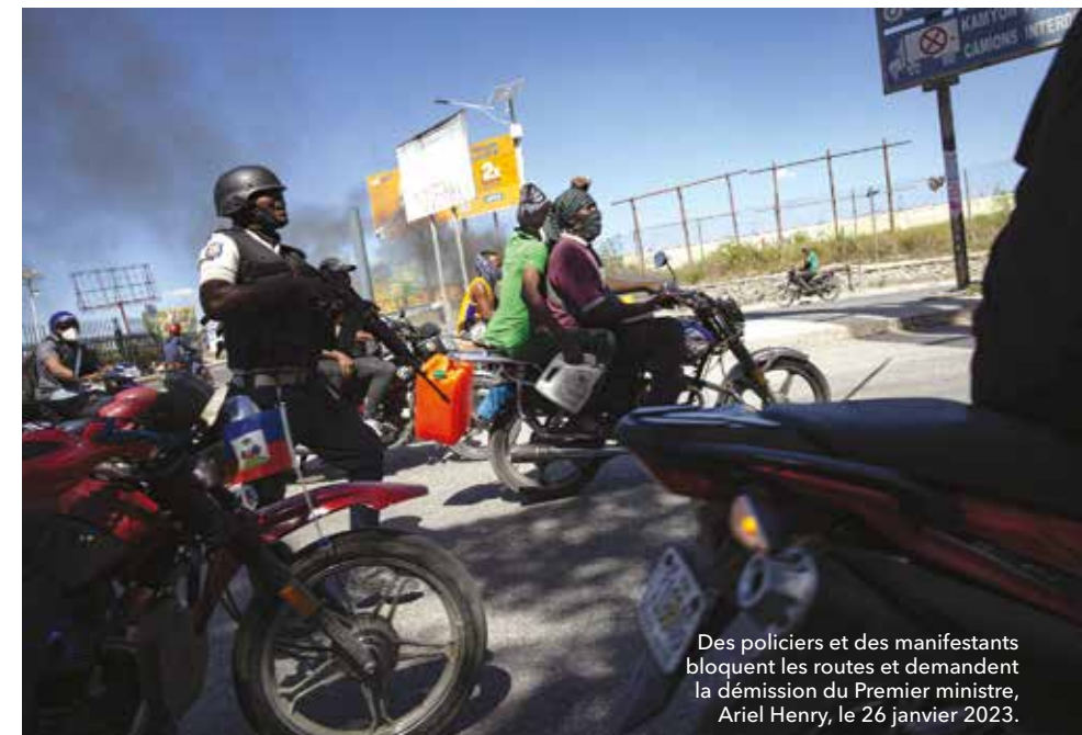
Des policiers et des manifestants bloquent les routes et demandent la démission du Premier ministre, Ariel Henry, le 26 janvier 2023.