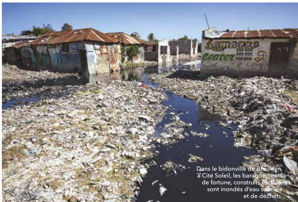
Dans le bidonville de Brooklyn, à Cité Soleil, les baraquements de fortune, construits en tôle, sont inondés d'eau souillée et de déchets.

les années 1960, des groupes armés sévissent en Haïti, accomplissant tantôt les basses besognes des régimes en place, tantôt obéissant à leurs desseins criminels – aussi bien sous le règne des présidents de la République Michel Martelly (2011-2016), de Jovenel Moïse (2017-2021) ou d'Ariel Henry, Premier ministre assurant la présidence par intérim depuis 2021. Tous appartiennent ou ont appartenu au parti haïtien Tèt Kale, à la ligne politique proche de celle d'un Trump ou d'un Bolsonaro : ultralibéralisme, populisme décomplexé, mépris du peuple et misogynie. Présente dans le pays entre 2004 et 2017, la mission des Nations unies pour la stabilisation en Haïti n'aura jamais réussi à y mettre de l'ordre.