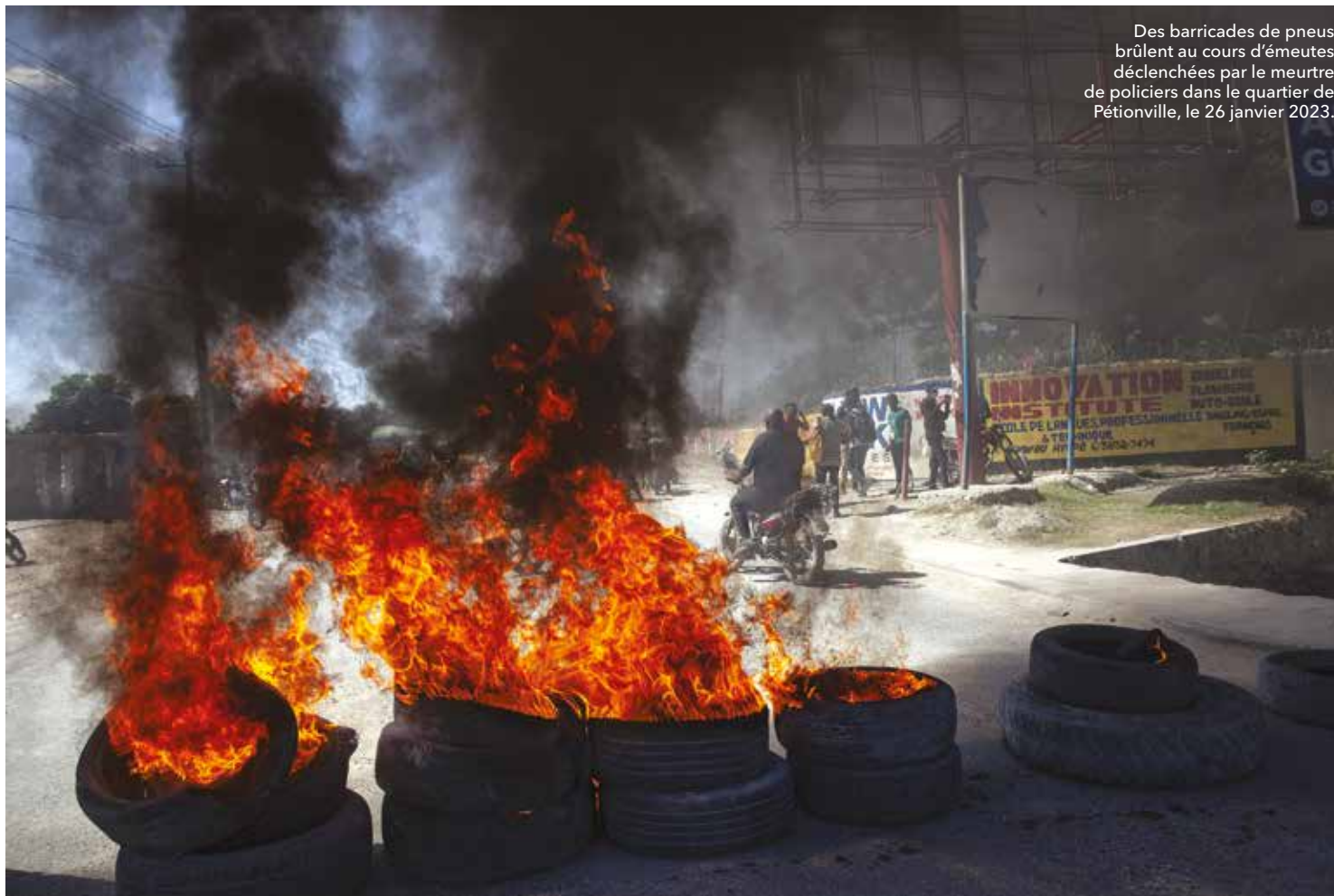
Des barricades de pneus brûlent au cours d'émeutes déclenchées par le meurtre de policiers dans le quartier de Pétionville, le 26 janvier 2023.

Véritables agents de la misère et du chaos, les gangs auraient fait 1 448 victimes, 1 145 blessés et commis quelque 1 005 kidnappings au niveau national en 2022, selon l'ONU. Des chiffres qui seraient sous-estimés, d'après diverses organisations de la société civile haïtienne. Les gangs contrôlèrent désormais plus de 70 % du territoire de Port-au-Prince. Face à eux, les forces de police, dépassées, sont depuis longtemps aux abonnés absents quand elles ne sont pas accusées de corruption ou d'entretenir des liens directs avec eux. La situation n'est pas nouvelle. Depuis