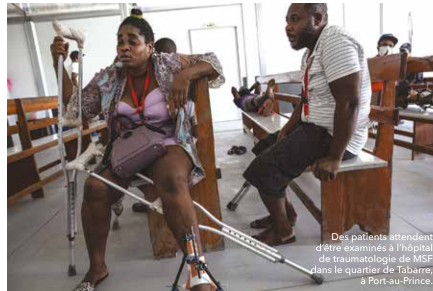
Des patients attendent d'être examinés à l'hôpital de traumatologie de MSF dans le quartier de Tabarre, à Port-au-Prince.