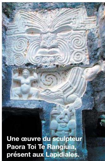
Une œuvre du sculpteur Paora Toi Te Rangiuia, présent aux Lapidiales.