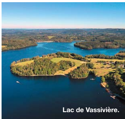
Lac de Vassivière.

D u Parc naturel des Mille-vaches à la Vallée des impressionnistes en passant par le lac de Vassivière et son ambiance «Petit Canada», la Creuse se découvre en prenant le temps. Grimpez par exemple dans le train qui part de Guéret empruntant le viaduc de Busseau-sur-Creuse pour visiter le joli village du Moutier d'Ahan ou le bassin houiller d'Ahan à la découverte de la vie des mineurs, puis terminez à Aubusson. La Cité de la Tapisserie dévoile actuellement une impressionnante série d'œuvres contemporaines en cours de réalisation, dont la création de monumentales tentures reproduisant l'univers de Miyazaki ( Princesse Mononoké, Le Voyage de Chihiro... ). De tempérament lièvre plus que tortue? Foncez sur le bitume du