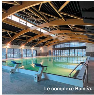
Le complexe Balnéa.