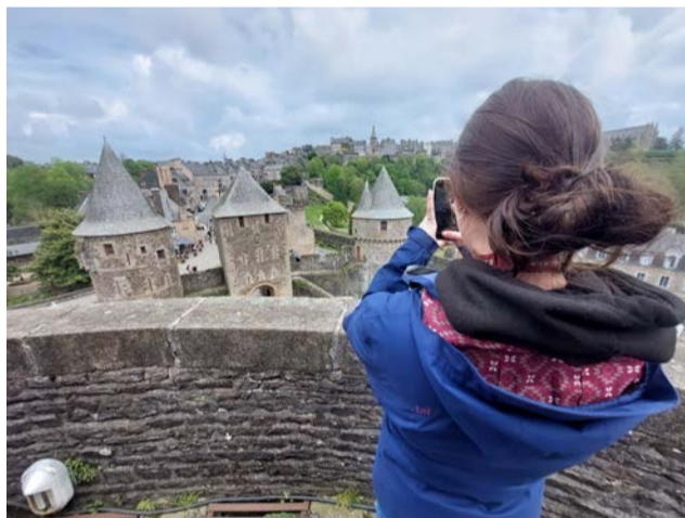
Fougères, son château, ses vieilles pierres, ont charmé une influenceuse Instagram de renom.

Elle poursuit : « Le château a été construit au XIIe siècle et a résisté aux sièges, aux guerres et surtout au passage du temps. Ses murs et ses tours murmurent des mythes et des légendes du passé, protégeant la Bretagne des incursions françaises. Aujourd'hui, la ville conserve une grande partie de son charme historique, avec des rues pavées tissant à travers des bâtiments à moitié boisés, des crêperies et des boutiques pittoresques. Les visiteurs peuvent explorer