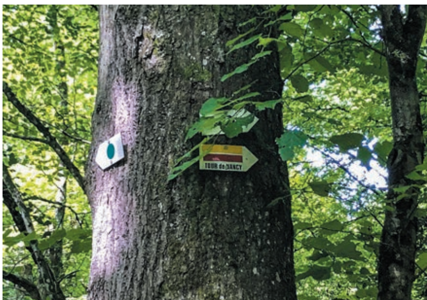
▲ La Cité d'Afrique est traversée par de nombreux itinéraires de randonnée