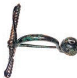
▲ Fibule à timbale datant du 1 er âge du fer, début du 5 e siècle av. J.-C.