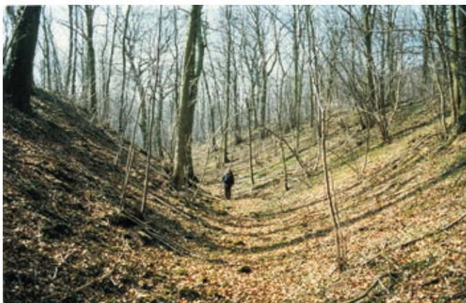
▲ Sur site , une observation attentive permet de repérer les talus et fossés matérialisant l'ancienne double enceinte de la Cité d'Affrique

Les fouilles ont permis de mettre au jour de nombreux vestiges témoignant d'une forte densité de population ►