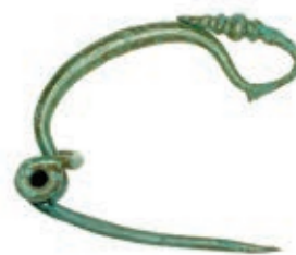
▲ Fibule du second âge du fer, fin du 5 e et début du 4 e siècle av. J.-C.