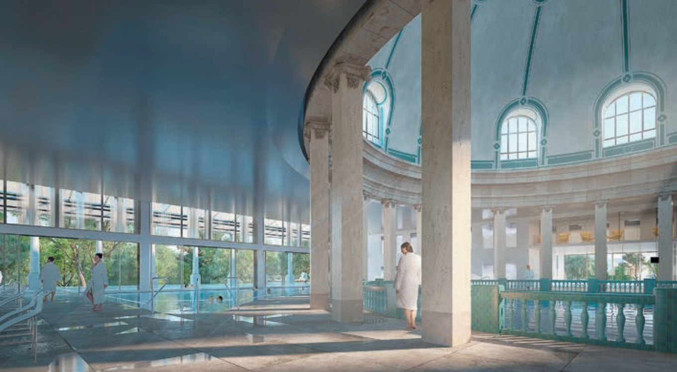
▲ L'offre bien-être du complexe thermal s'articulera autour de la piscine ronde et de sa splendide coupole surplombant la source Lanternier © Anne Démians / Chabanne + Partenaires