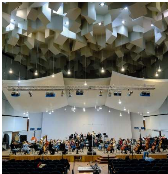
De haut en bas: le salon conservé en l'état de Boris Lyatoshynsky; le monastère Saint-Michel-au-Dôme-d'Or de Kiev; un enregistrement de l'Orchestre de la Radio ukrainienne.

vous coupe une main à Kiev.» Travailler à composer tout au long d'une vie était loin d'être garanti pour un compositeur de la RSS d'Ukraine. La présidente de la Fondation Lyatoshynski nous conte la vie dramatique du compositeur Vasyl Barvinsky: «Arrêté par les autorités communistes, contraint de brûler toutes ses partitions dans la cour du Conservatoire de Lviv, envoyé pour dix ans au goulag, il est revenu en Ukraine et a tenté de retranscrire les souvenirs fragmentés de ses œuvres.»