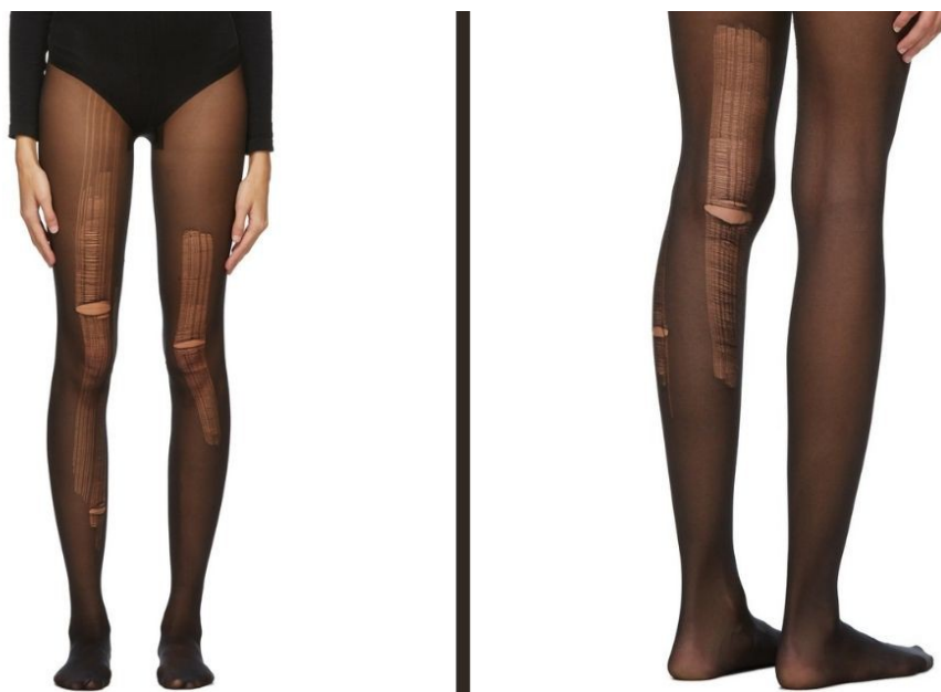
Collants déchirés sur le site internet Gucci.com

C'est avec des collants troués que Gucci semble poursuivre la mode.