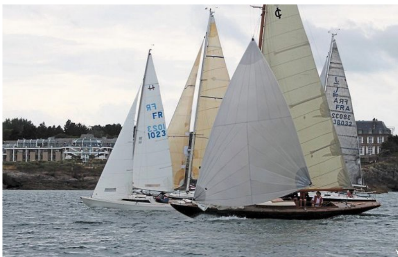
La course sera spectaculaire, comme ici, lors d'un passage sous le Thalassa.