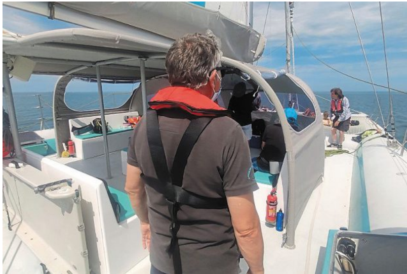
La catamaran Ephata mesure 18 mètres de long.