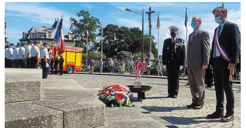
Commémoration du 76 e anniversaire de la libération de Dinard.

Chacun s'est recueilli au cimetière, à l'église et au monument aux morts, samedi, en souvenir de la libération.