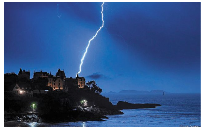
Un éclair capturé par Vincent Lemaire, ce week-end.