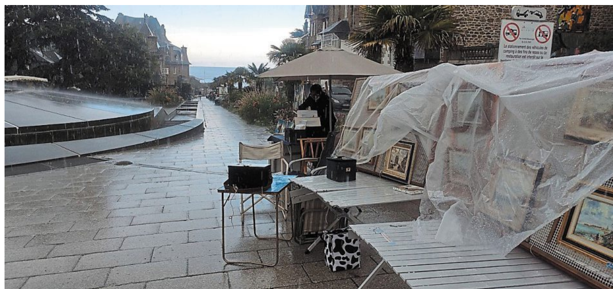
À l'abri ! La pluie s'est abattue sur l'exposition vers 15 h.