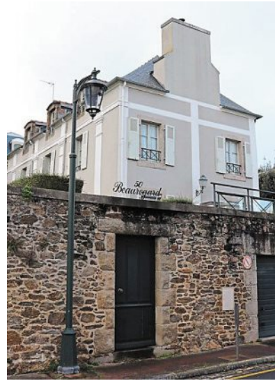
La villa Beauregard a été léguée à la Ville, puis vendue aux enchères.