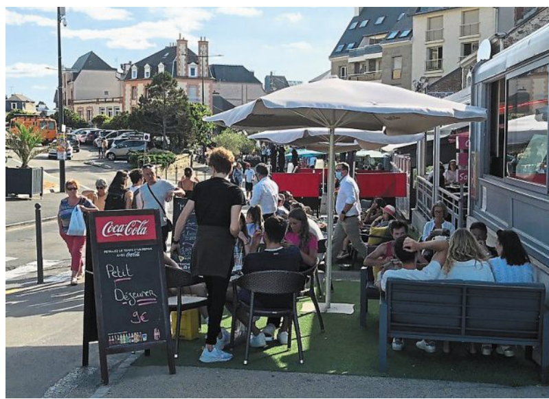
Les modifications de circulation et les terrasses installées sur la voie publique sont maintenues jusqu'au 1 er novembre.