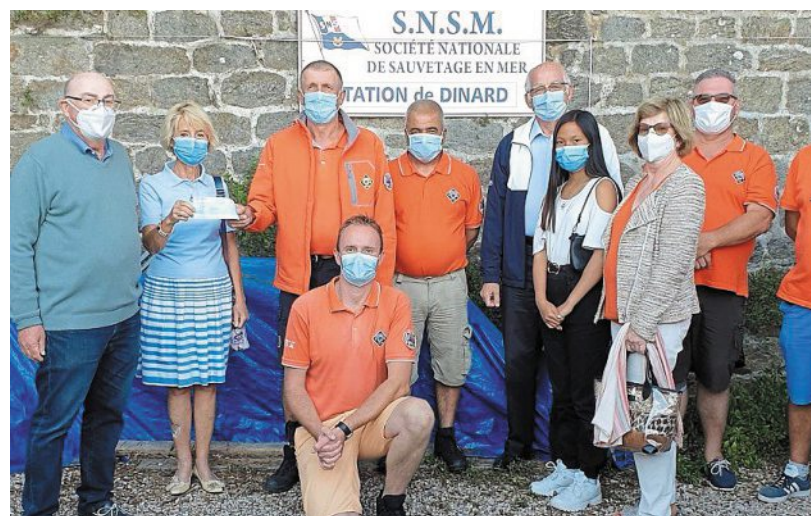
Les sauveteurs en mer ont apprécié le geste des Bretons de Rueil-Malmaison.