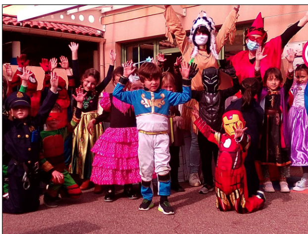
Le carnaval à la maternelle.