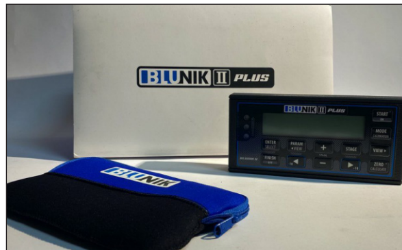
Boîtier de course rallye offert par Blunik Espagne.

légendes passer sur son tracé. Alpine avait notamment remporté le Rallye de Monte-Carlo en 1971 et 1973.