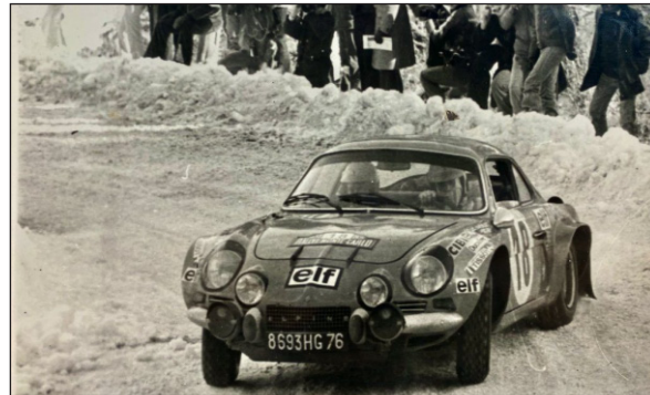
Photographie signée de Jean-Claude Andruet sur A1800 au Rallye de Monte-Carlo 1981.