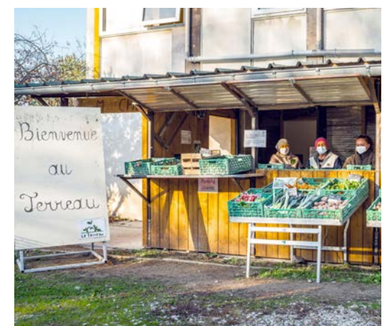
Le terreau organise son traditionnel marché de printemps mercredi 24 mars.

L'association Le Terreau organise son marché de printemps mercredi 24 mars à Cruas (Route des Serres), de 9h à 17 heures. La journée sera rythmée par des animations : ateliers plantations, visite de jardins avec le chef de culture, contes pour enfants (sur réservation par mail ou téléphone, nombre de places limité). Le marché proposera les légumes bio produits par l'association, et des produits de partenaires locaux (fruits, pains, œufs, miel, huile de noix...). Des producteurs seront présents : la ferme du Grezou (pâtes et farine bio l'après-midi) et My Step Family (savons naturels). Ce sera également l'inauguration de la boîte à livres entièrement réalisée par les salariés en insertion du Terreau. Contact : Facebook Association Le Terreau, adherents.terreau@gmail.com et 04 75 54 61 75.