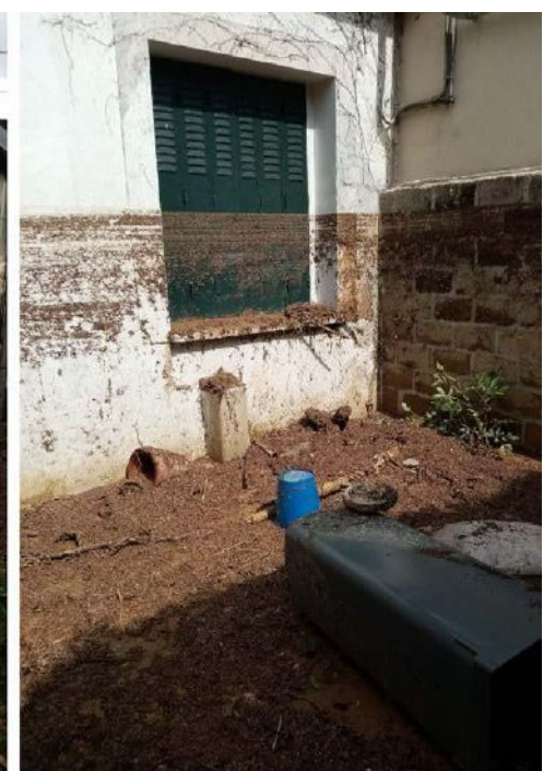
La boue séchée témoigne de la hauteur des coulées et de la violence des impacts