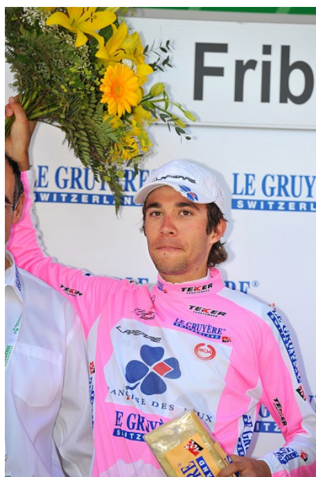
Un visage qui en 2010 nous est inconnu...

Encore mieux l'année d'après car il termine seulement 19 secondes derrière le vainqueur final Nairo Quintana. La progression est visible à partir de ce moment-là. Pierre Latour rapporte le maillot de meilleur jeune.