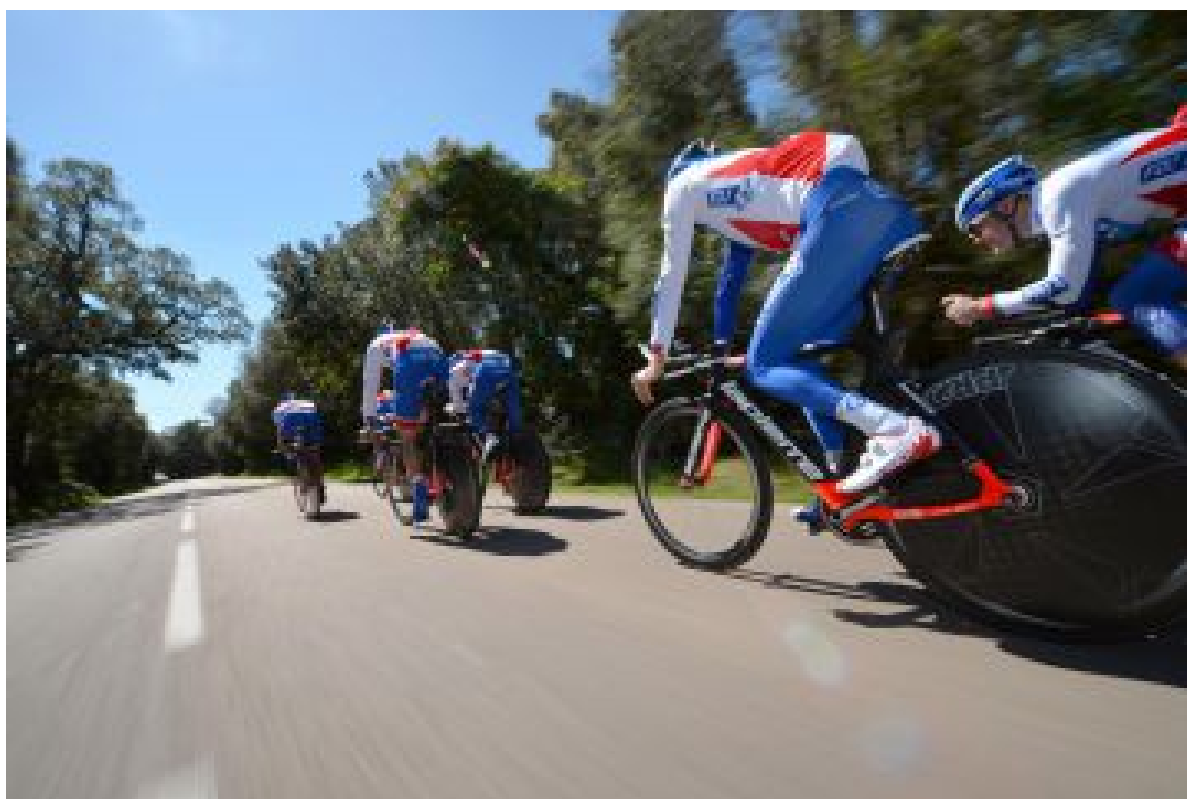
Dans le sillage de la FDJ en 2015

Et puis toujours dans le domaine du chrono, c'est encore et toujours la FDJ, qui décidément adore le début du Tour de Romandie, qui termine 7 ème du contre-la-montre par équipes 22 secondes derrière l'équipe gagnante Sky.