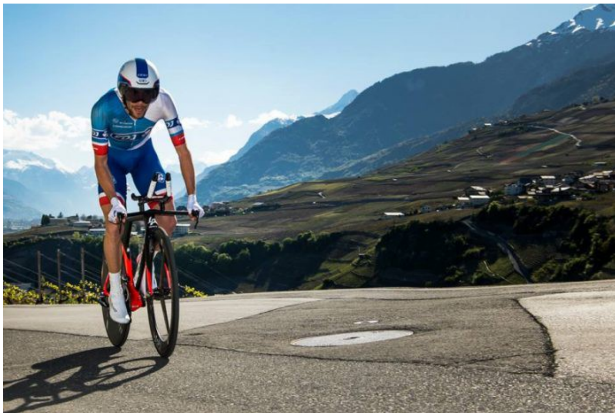
Thibaut Pinot s'offre Tom Dumoulin

En cette année où Thibaut Pinot, champion de France du chrono quelques jours plus tard et futur avenir du cyclisme français, a la possibilité de faire naître son talent, il prouve sa force lors d'un contre-la-montre montagnard où il s'offre le spécialiste du CLM et bon grimpeur Tom Dumoulin. Une vraie prouesse pour lui, ayant le CLM comme faiblesse à ce moment-là.