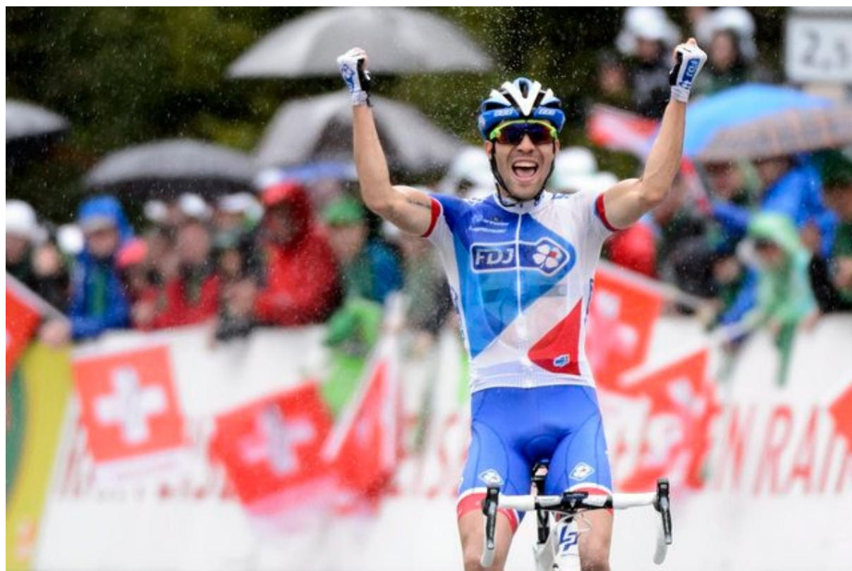
Thibaut Pinot jubile

Thibaut Pinot, après son magnifique contre-la-montre, enchaîne avec une victoire de prestige sur l'étape reine en 2015 7 secondes devant Ilnur Zakarin. Il fera 3 ème aussi de l'étape 5 l'année d'après.