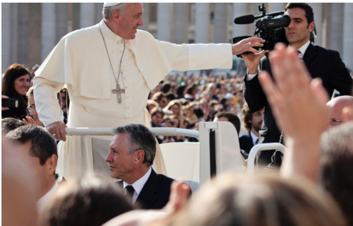
Etat du Vatican, 30 octobre 2013, le Pape François bénissant la foule de croyants sur l'esplanade de la basilique Saint-Pierre

Pour la première fois dans l'histoire, un pape est en visite sur le territoire irakien du 5 au 8 mars 2021. Un voyage qui s'annonce comme l'un des plus compliqués de son pontificat. Un but : aider le pays dans sa reconstruction et afficher son soutien aux minorités chrétiennes. Le tout dans un pays où le simple fait d'être chrétien met sa vie en danger.