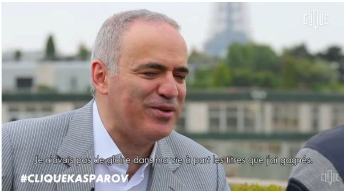
Garry Kasparov dans l'émission Clique de Mouloud Achour

Lien vers la vidéo : https://www.youtube.com/watch?v=EstNmandfC8