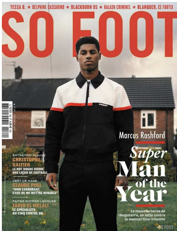
(Une de SOFOOT #182)