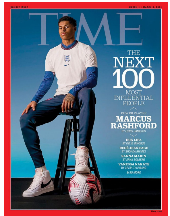
(Une du Time du mois de Mars)