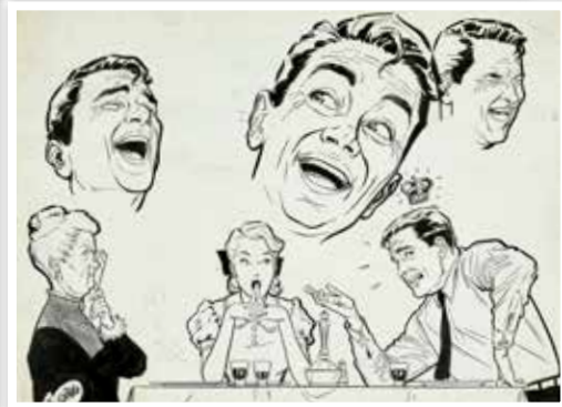
Haut : Uderzo, Clopinard, 1945 - Gauche : Uderzo, Oumpah-Pah, 1957 et Uderzo, Pour Bonnes Soirées, 1952