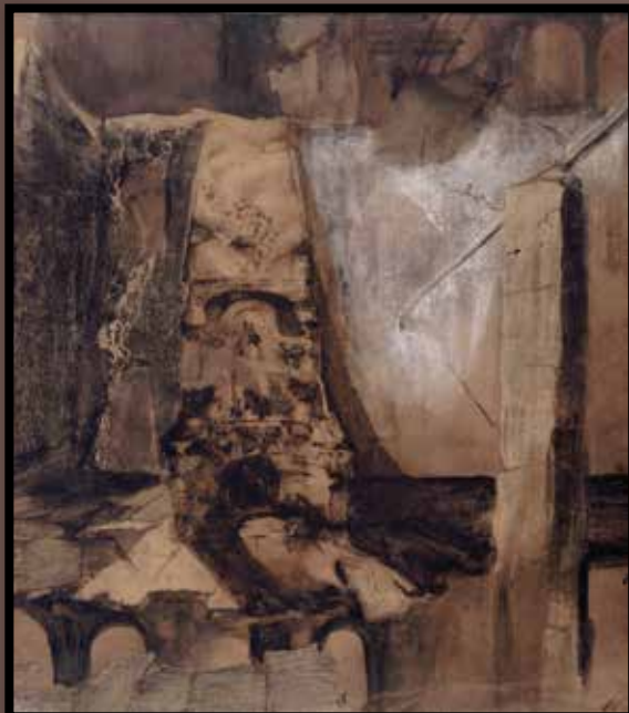
Victor Hugo, Hic clavus, alias porta