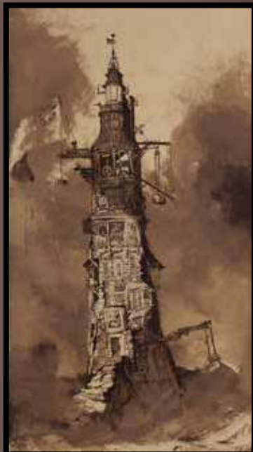
Victor Hugo, Phare d'Eddystone, 1856

Qui pouvait imaginer qu'une des plus grandes figures de la littérature française savait déployer la même virtuosité à l'encre qu'à la plume ? Qui pouvait croire que dans le génial fouillis de ses écrits, de ses correspondances, de ses récits de voyages, de ses poèmes et de ses mémoires dormaient près de quatre mille œuvres d'art ? Victor Hugo les a élaborées dans le plus grand des secrets, ne voulant pour rien au monde que son œuvre littéraire en soit éclipsée. Hugo dessinait le plus souvent au stylo et à l'encre noire délavée, n'hésitant pas à tacher la feuille avec du charbon ou du café, à peindre